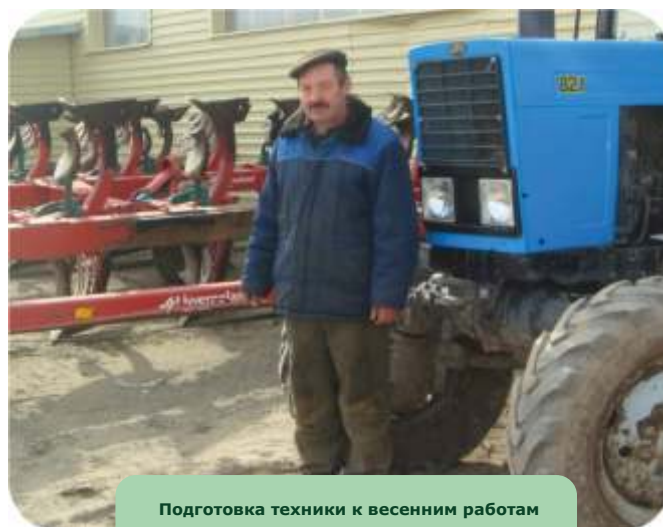
Подготовка техники к весенним работам